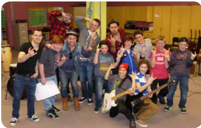
4 – Les membres du groupe Automat ont échangé avec des élèves dans le cadre du volet formation du projet Jam Ado