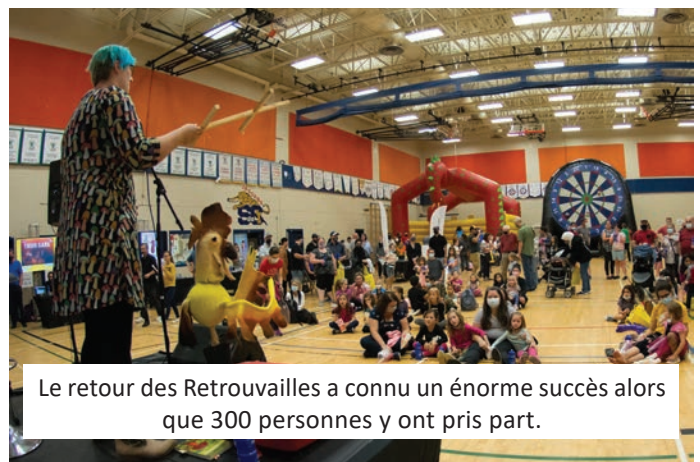
Le retour des Retrouvailles a connu un énorme succès alors que 300 personnes y ont pris part.