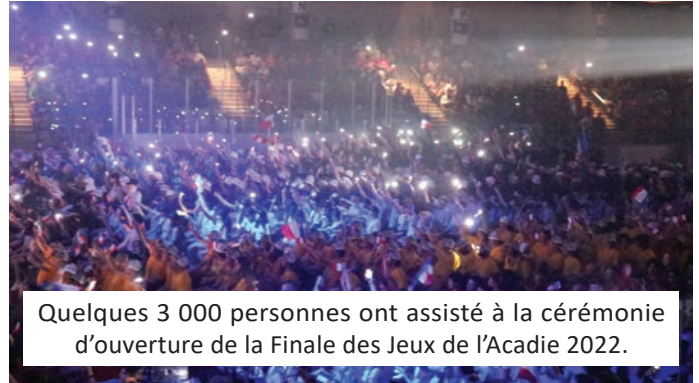
Quelques 3 000 personnes ont assisté à la cérémonie d'ouverture de la Finale des Jeux de l'Acadie 2022.